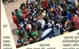
मुलांच्या आजादातून 'आरंभ'ची प्रेरणा...