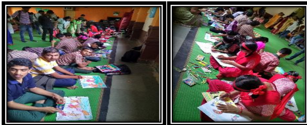
Aarambh's students participated in a drawing competition organized by "MARG"