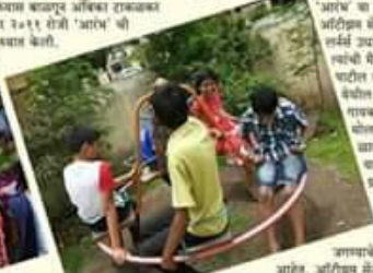
मुळांचे भौतिक सुमनस करून त्यांच्या परवडू लागत येऊन बसले...