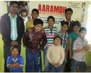
मुलांच्या आजादातून 'आरंभ'ची प्रेरणा... मुळांच्या भौतिक सुमनस करून त्यांच्या परवडू लागत येऊन बसले...