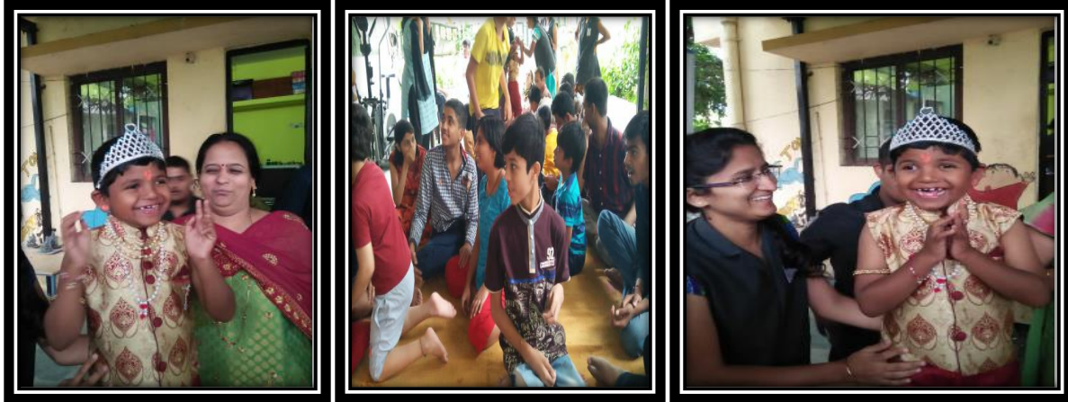
On 18th August Aarambh celebrated Gokulastami. Students came with different costumes.